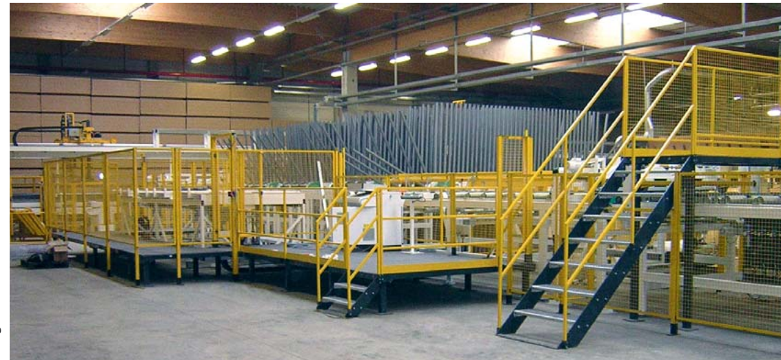
Design: FMC • www.flotho.de